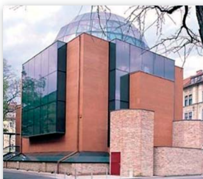
Synagoge Graz - hat schon viel zum besseren Verständnis von Juden und Nicht-Juden beigetragen

Wir wünschen unseren LeserInnen eine friedliche Weihnachts- und Chanukkazeit sowie ein segensreiches Jahr 2009!