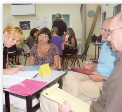
Österreichische Lehrer bei Gruppenarbeiten im Center for Humanistic Education