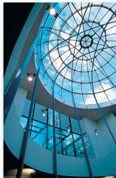
Kuppel der Synagoge Graz

„Christen an der Seite Israels – Österreich“ gratuliert Herrn Sonnenschein herzlichst zu dieser Auszeichnung!