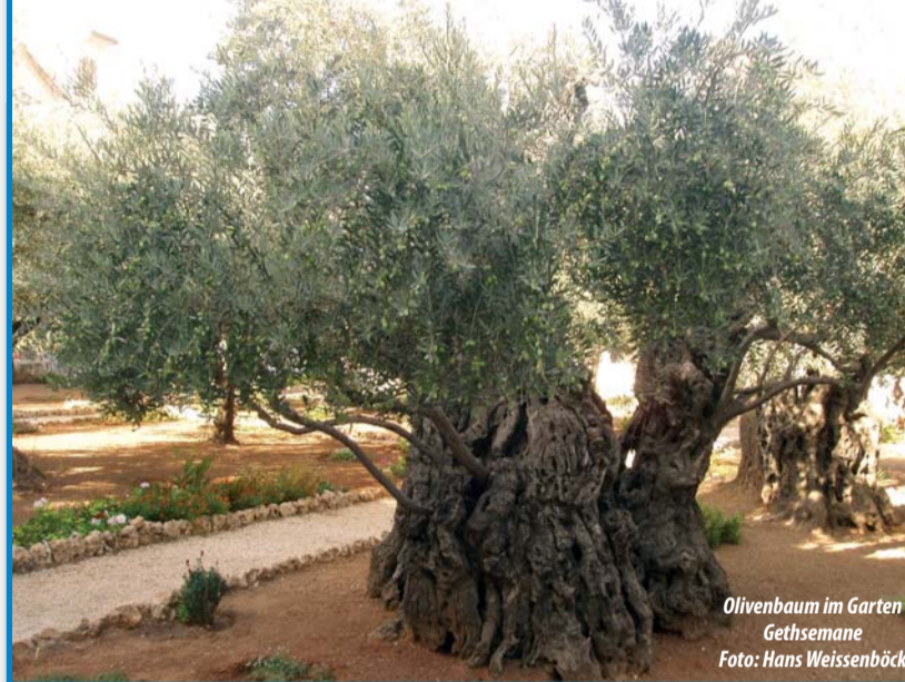
Olivenbaum im Garten Gethsemane

Nähere Einzelheiten bzgl. Programm, Preis, Reiseleitung und Anmeldung ab Januar: Auf www.israelaktuell.at oder Folder anfragen bei: „Christen an der Seite Israels -Österreich“, Mühlbergstr.44/9, 1140 Wien E-mail: info@israelaktuell.at Tel. 01 9795109