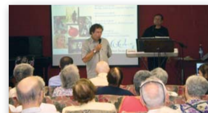
Besuch im Klub der österreichischen Pensionisten in Tel Aviv