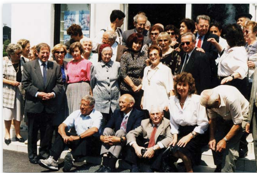
Gruppenfoto aller Teilnehmer bei der ersten Woche der Begegnung im Mai 1995

Die nächste Ausgabe ist für Mai 2009 geplant. Aktuelle Informationen und News finden Sie auch auf unserer Homepage www.israelaktuell.at