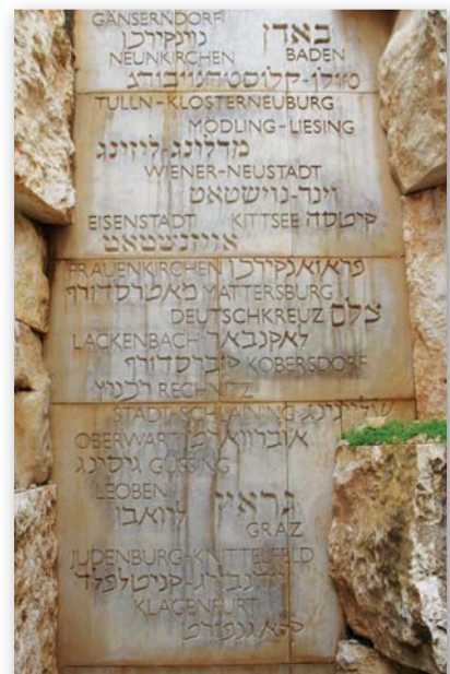
Holocaust-Gedenkstätte Yad Vashem - Im Tal der verschollenen Gemeinden

Er unterstrich, dass sich auch Christen an diesem großen Verbrechen beteiligt oder weggeschaut haben: Es habe „Gerechte unter den Völkern“ gegeben, die unter Einsatz ihres Lebens jüdische Menschen retteten, „aber es waren zu wenige“. Christen sollen sich vor den jüdischen Wurzeln ihres Glaubens beugen, so Schönborn. Das sei besonders in einer Zeit wichtig, in der die dramatischen Konflikte in Nahost die Gefahr eines Aufflammens alter antisemitischer Vorurteile beinhalteten, so