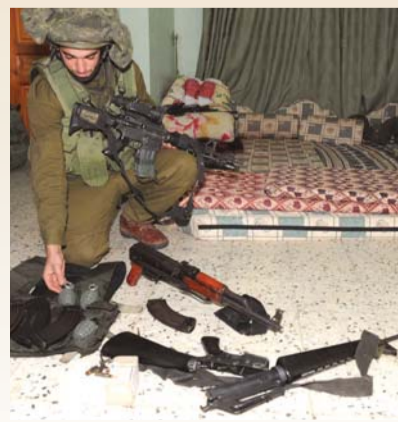
IDF-Soldaten entdecken ein Hamas-Waffenlager in einer Moschee