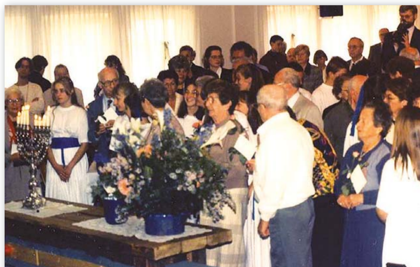
Der Moment, in dem wir unsere jüdischen Gäste um Vergebung bitten

An einem Tag planten wir ein Treffen in unserem Gemeindezentrum mit unserer ganzen Gemeinde, im Rahmen dessen wir unser eigentliches Anliegen, sie von Angesicht zu Angesicht um Vergebung zu bitten, ausdrückten. Viele Tränen flossen auf beiden Seiten.