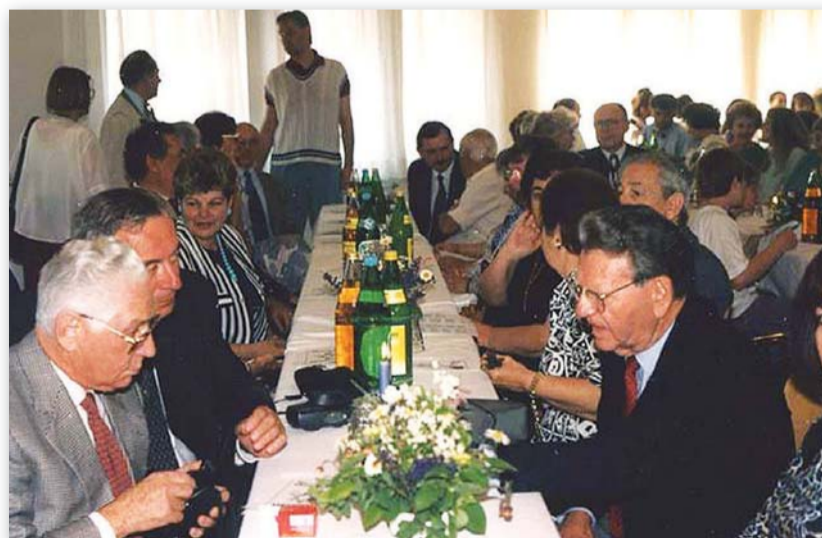
Festversammlung mit unseren jüdischen Gästen in unserem Gemeindezentrum