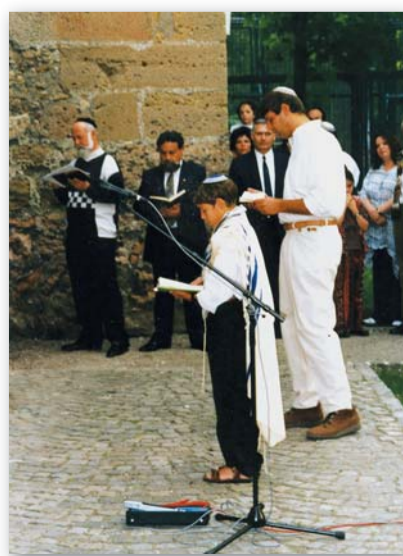
Schabbatgottesdienst vor der Stadtmauer

Gott überführte uns von der tiefen Schuld, die wir als Christen auch in unserer Stadt den Juden gegenüber auf uns geladen hatten und die im Holocaust besonders sichtbar wurde.