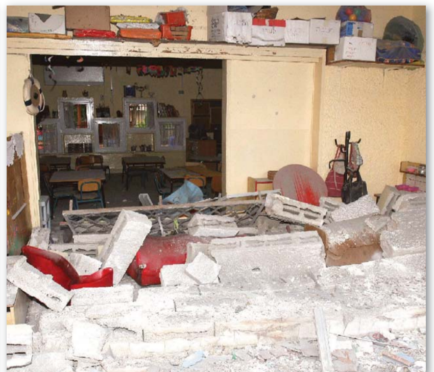
Zerstörter Kindergarten in der israelischen Stadt Ashdod nach dem Einschlag einer Grad-Rakete der Hamas im Jänner 2009