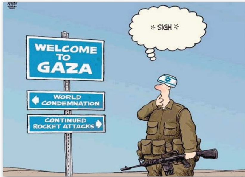
Die Alternativen: Verurteilung durch die Welt oder täglicher Beschuss durch Raketen.

Der Raketenbeschuss aus dem Gaza-Streifen begann im Jahr 2000. Seit dem Abzug der israelischen Armee im Jahr 2005 ist er sprunghaft angestiegen. Er ist also keine Reaktion auf die Teilblockade des Gaza-Streifens seit Anfang dieses Jahres, sondern Ausdruck des permanenten Krieges gegen Israel, dem sich die Hamas verschrieben hat. 2006 feuerten palästinensische Kommandos 946 Raketen auf Südisrael. Von Juni 2007 bis zur Teilabriegelung des Gaza-Streifens Mitte Januar 2008 waren es über 1700. Insgesamt schlugen seit 2001 etwa 4000 Raketen und Granaten aus dem Gaza-Streifen auf israelischem Territorium ein. Seit Beginn dieses Jahres waren es mehr als 1000 Raketen und 1200 Mörsergranaten. Dutzende Grad-Raketen aus iranischer Produktion schlugen in der Stadt Ashkelon ein. In den letzten Wochen,